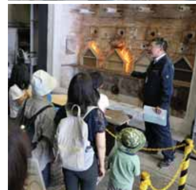
燃えにくい家を考えてみよう!