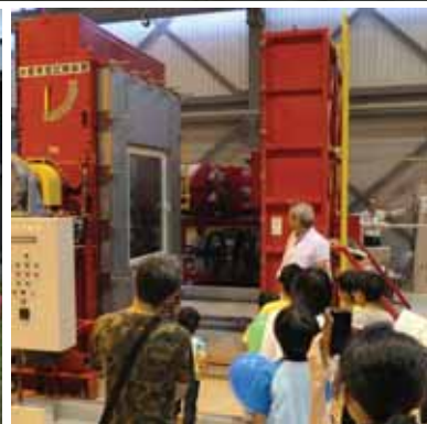
博士と研究所を探検しよう!