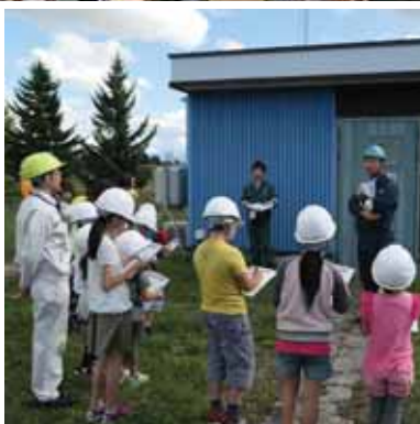
安全な家かどうか調査しよう!